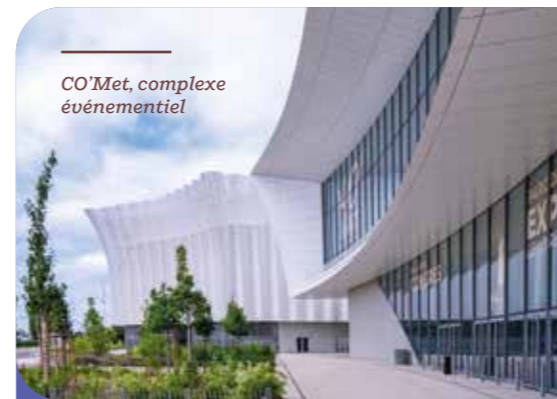
CO'Met, complexe événementiel

Acteur majeur de la logistique, le groupe Deret s'est développé à Saran tout en conservant une gestion familiale. Innovant et engagé, il s'illustre par des solutions durables au service de la logistique moderne.