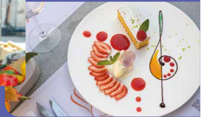
Dessert du Menu Signature Loiret