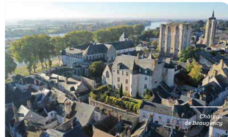
Château de Beaugency

Au château de Beaugency, c'est l'art numérique qui prend vie, grâce aux installations immersives et poétiques qui transforment le monument en un étonnant espace de création contemporaine. Une rencontre entre patrimoine et innovation qui attire un public curieux et intergénérationnel.