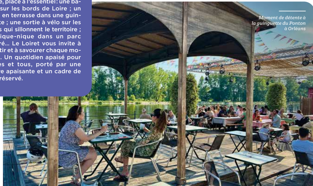
Moment de détente à la guinguette du Ponton à Orléans

Après le travail ou en fin de semaine, place à l'essentiel : une balade sur les bords de Loire ; un verre en terrasse dans une guinguette ; une sortie à vélo sur les pistes qui sillonnent le territoire ; un pique-nique dans un parc arboré... Le Loiret vous invite à ralentir et à savourer chaque moment. Un quotidien apaisé pour toutes et tous, porté par une nature apaisante et un cadre de vie préservé.