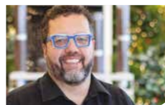
ALEX LUTZ COMÉDIEN

« Je suis fier de mon territoire et y suis réellement attaché : il y a tellement de choses à y voir, à y faire ! La forêt