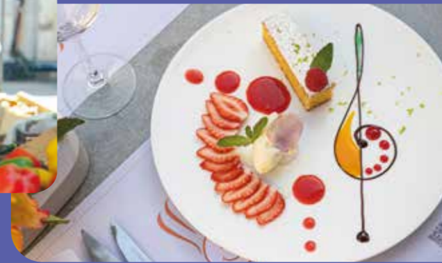
Dessert du Menu Signature Loiret