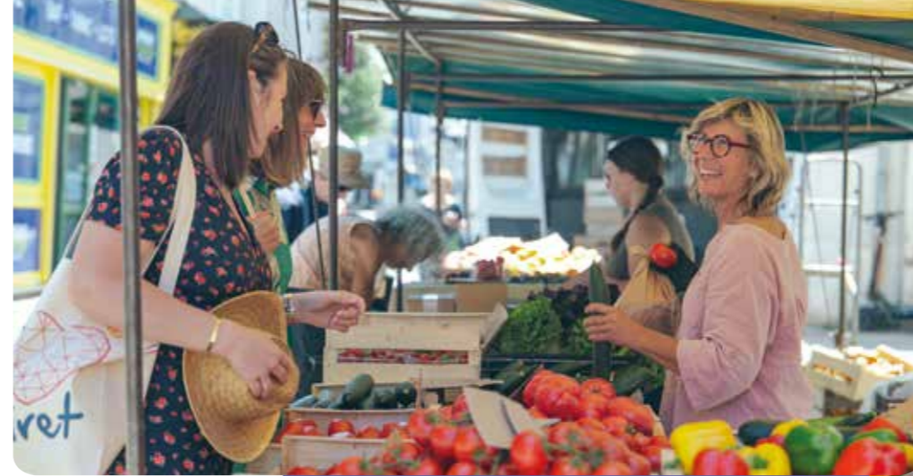
Maraîcher au marché d'Olivet