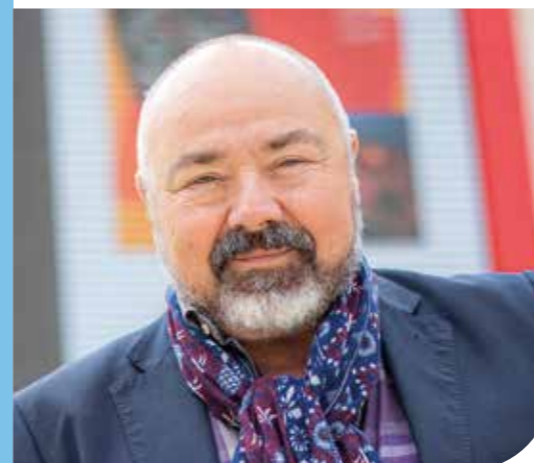
CHRISTOPHE MALAVOY ACTEUR ET RÉALISATEUR

« Les artistes qui se produisent au Centre national de création Orléans - Loiret restent deux semaines entières avec nous, deux semaines durant lesquelles ils deviennent nos ambassadeurs. Le Loiret, c'est la douceur de vivre, la quiétude du climat ligérien, l'éloignement du stress... C'est ravissant, nourrissant au niveau de l'esprit. Ils profitent de la force de proposition de la ville et découvrent les lieux de distraction. Il n'est d'ailleurs pas rare qu'ils cherchent une maison dans le département après ce séjour ! »