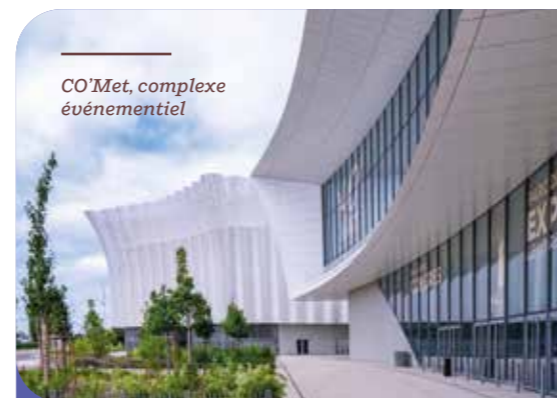
CO'Met, complexe événementiel

Acteur majeur de la logistique, le groupe Deret s'est développé à Saran tout en conservant une gestion familiale. Innovant et engagé, il s'illustre par des solutions durables au service de la logistique moderne.